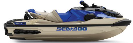
Sand y Dazzling Blue